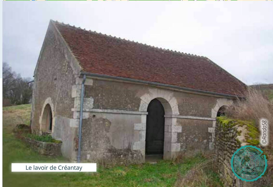
Le lavoir de Créantay