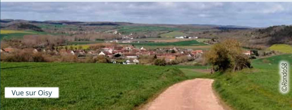
Vue sur Oisy