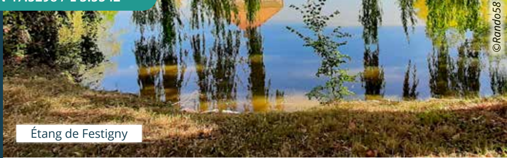
Étang de Festigny