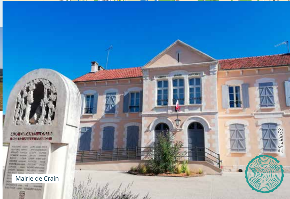
Mairie de Crain

Les nombreux sites touristiques environnants : les bords de l'Yonne, le village de Festigny, et un peu plus loin sur la place de la commune de Coulanges la statue du floteur.