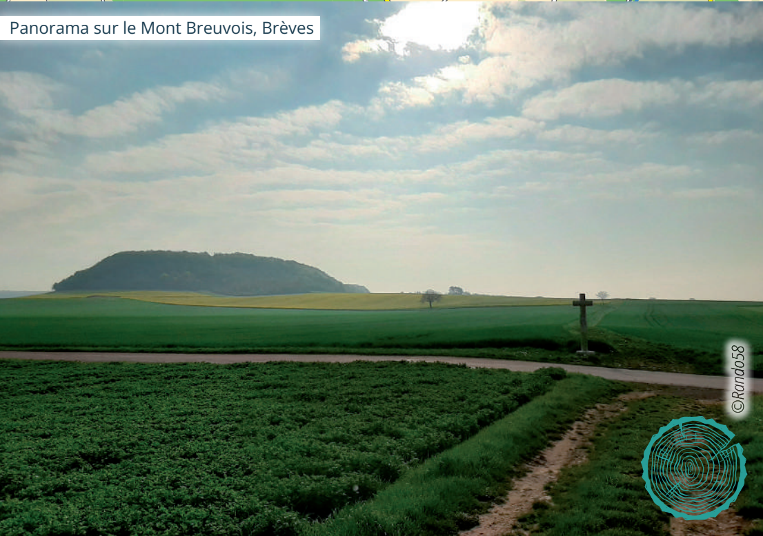
Panorama sur le Mont Breuvois, Brèves